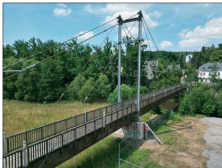
Seit 2022 wick die Stegbrücke nun einem Ersatzneubau.

Umrahmung die neue Brücke zu bestaunen. Wir freuen uns, wenn viele unserer Einladung folgen und gemeinsam einen geselligen Nachmittag erleben. Die Einweihungsfeier nehmen wir zum Anlass für ein zukünftiges jährlich stattfindendes Brückenfest unter dem Motto *Brücken verbinden* .