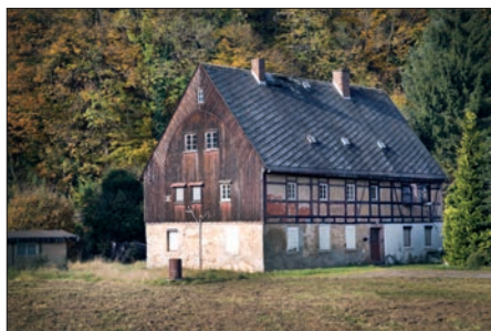
Das Anwesen der alten Schmelzhütte beinhaltete nach wechselvollen Besitzverhältnissen das Wohnhaus „Alte Walke“. Es war eines der ältesten erhaltenen Wohnhäuser von Falkenau.

Der Falkenauer Bergbau erblühte in der 2. Epoche des sächsischen Bergbaues um 1562. Im Jahre 1583 wurde das Auen- gelände linksseitig der Flöha, zwischen Hetzdorf und Falkenau, vom damaligen Besitzer des Falkenauer Schänkungutes (heute Fabrikweg 3) erworben. Das Grundstück von 100 Schock oder 25 gute Groschen (reine Silbergroschen ohne Kupferanteil) hatte erst Kurfürst August, Herzog zu Sachsen, im Jahre 1575 von Michael Becker gegen Barzahlung erworben. (1) Die Grundstücksgröße betrug 1200 Routen (ca. 5000 qm) und ist in der Oederkarte von 1586 - 1602 bereits als Walkmühle verzeichnet. Der Käufer be reute jedoch später den Verkauf und hat te um Rückkauf petitioniert. (2)