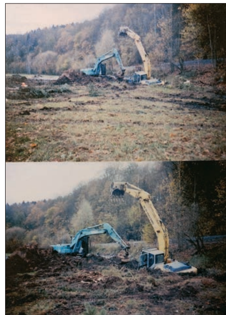
Bei Renaturierungsmaßnahmen der Walke im Oktober 2017 versank der Abrissbagger im verschütteten Betriebswassergraben und konnte nur durch Herbeiführung eines weiteren Baggers befreit werden.

und somit konnte die städtische Wohnungsverwaltung- und -baugesellschaft Flöha das Gebäude für 30 000,-Euro abreißen und renaturieren. Das letzte Bergbaugebäude war somit Geschichte. Es hatte bis zum Schluß keinen Trink- und Abwasseranschluß. (5)